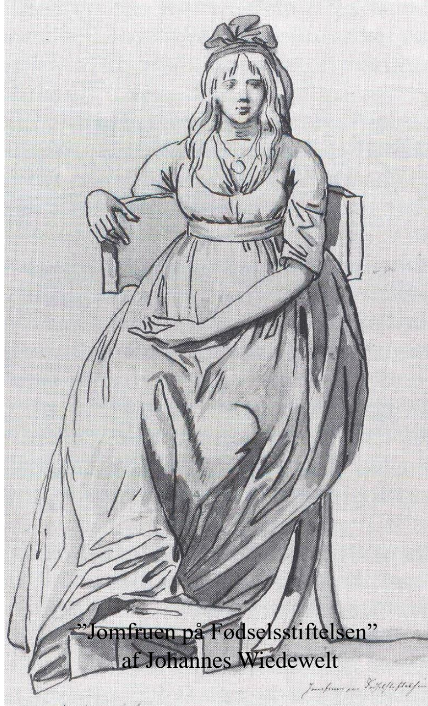
”Jomfruen på Fødselsstiftelsen” af Johannes Wiedewelt